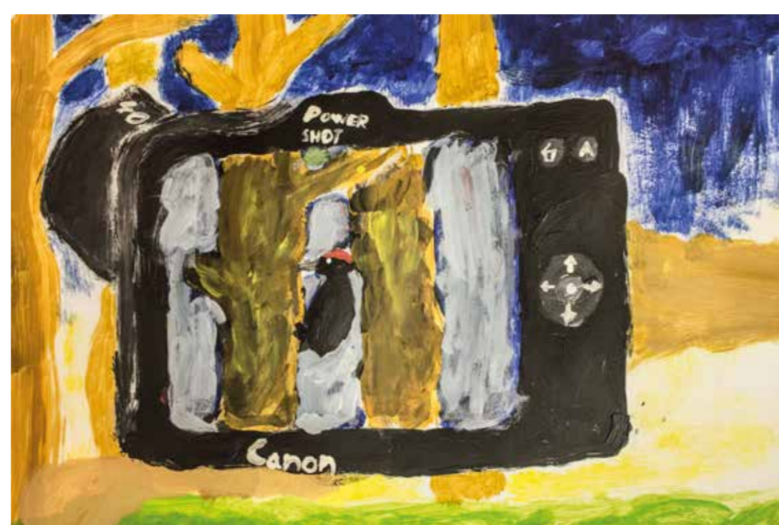
žák Jáchym Vlk narozen 2007