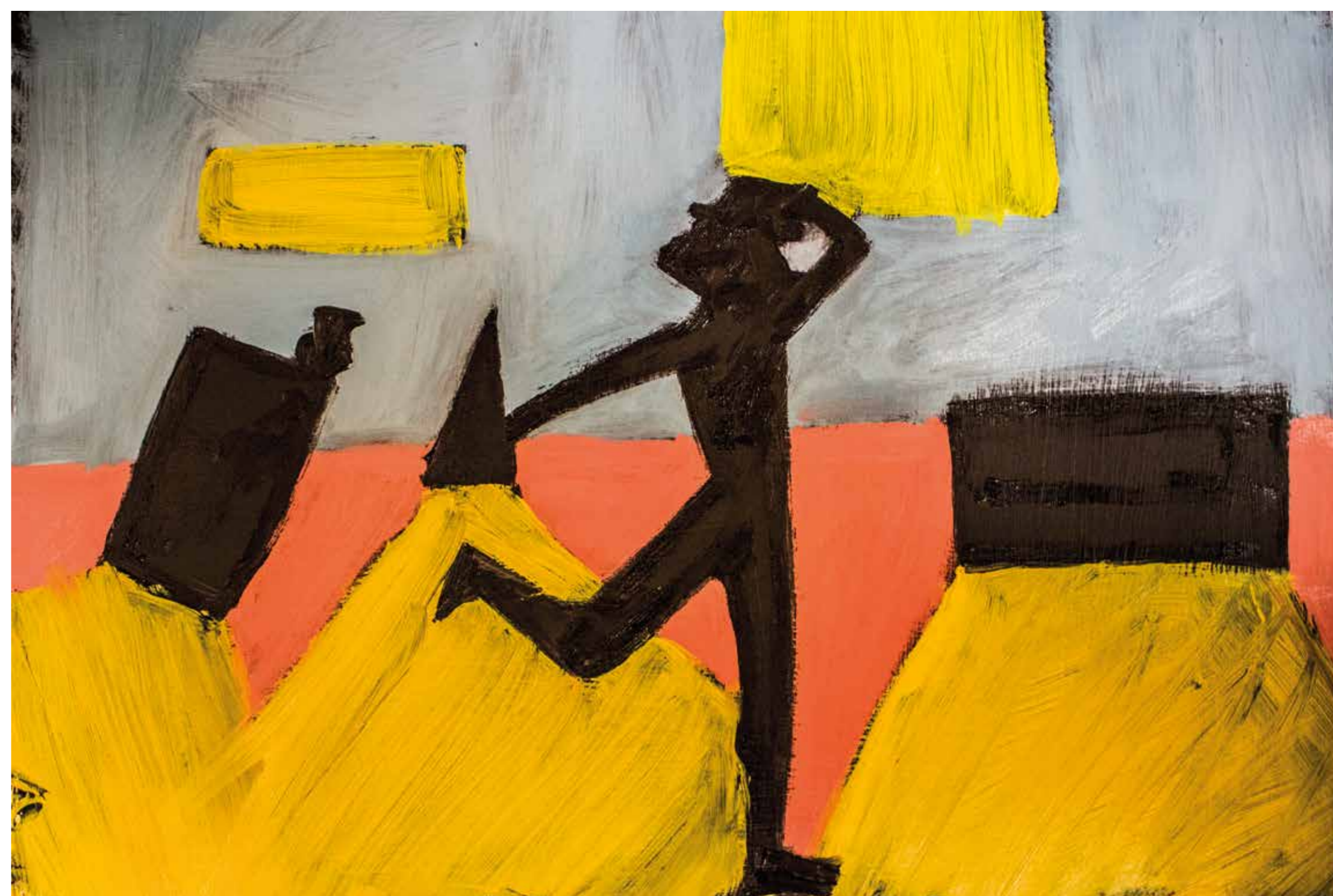
žákyně Beatrice Dumitrita Gutu narozena 2005